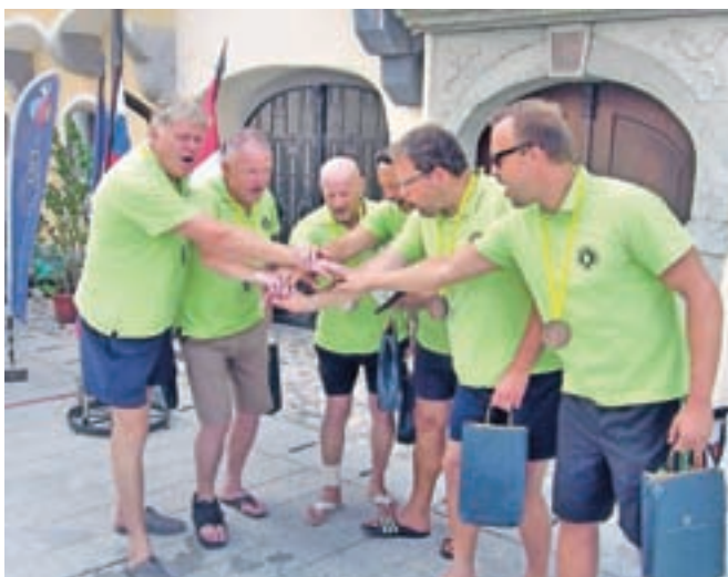
Popoln uspeh ŠD Rokce