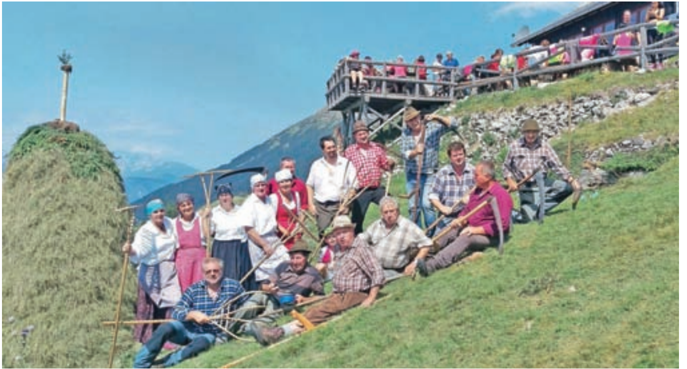
Zadovoljni kosci in grabljice po opravljenem delu

Zadnji »snoseki« so bili na Begunjščici leta 1962. Po pripovedovanjih starejših koscev, ki se še spominjajo, kako je potekala košnja, so kosci vstajali zgodaj zjutraj. Skrbno skovane kose so najlepše odrezale travo, prepojeno z roso, v svežem jutru pa so kosci privarčevali nekaj moči, saj je poletno sonce pomenilo dodaten napor na že tako strmem terenu, na katerem so kosci potrebovali posebne dereze, da so sploh lahko kosili. Nekoč je tako vsako leto seklo tudi po štirideset »snosekov«, sicer vsak v svojem kopišču, zvečer pa so se zbrali ob svislih, kuhali žgance ter si pripovedovali različne zgodbe pozno v noč. Seno so potem skrbno pograbili proti mestu, kjer so postavili kopo. Po bese-