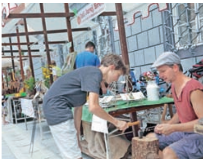
Obiskovalci so posebno navdušeno obiskovali stojnice, kjer so lahko sodelovali pri nastajanju izdelkov. / FOTO: GORAZD KAVČIČ