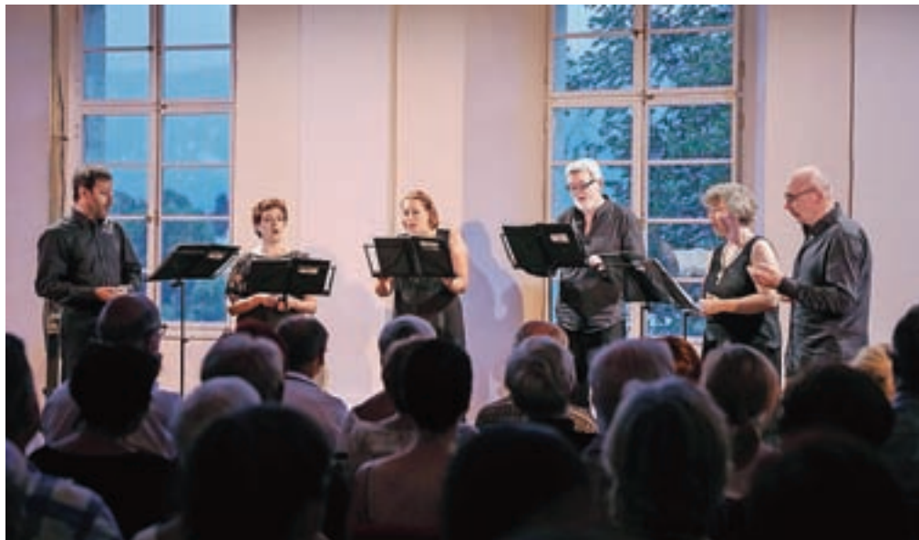
La compagnia del madrigale na uvodnem koncertu 35. Festivala Radovljica

Predzadnji koncert festivala bo posvečen francoski glasbi 20. stoletja za kvintet flavte, harfe in godal. Na sklepnem večeru pa bo Ensemble Danguy, ki ga vodi kanadska virtuoziinja na strunski lajni Tobie Miller, predstavil virtuosno glasbo za lajno iz Francije 18. stoletja.