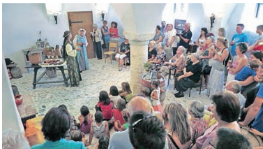
Graščinska klet je bila prvič prizorišče gledališke predstave, tokrat o Meti Romarici.