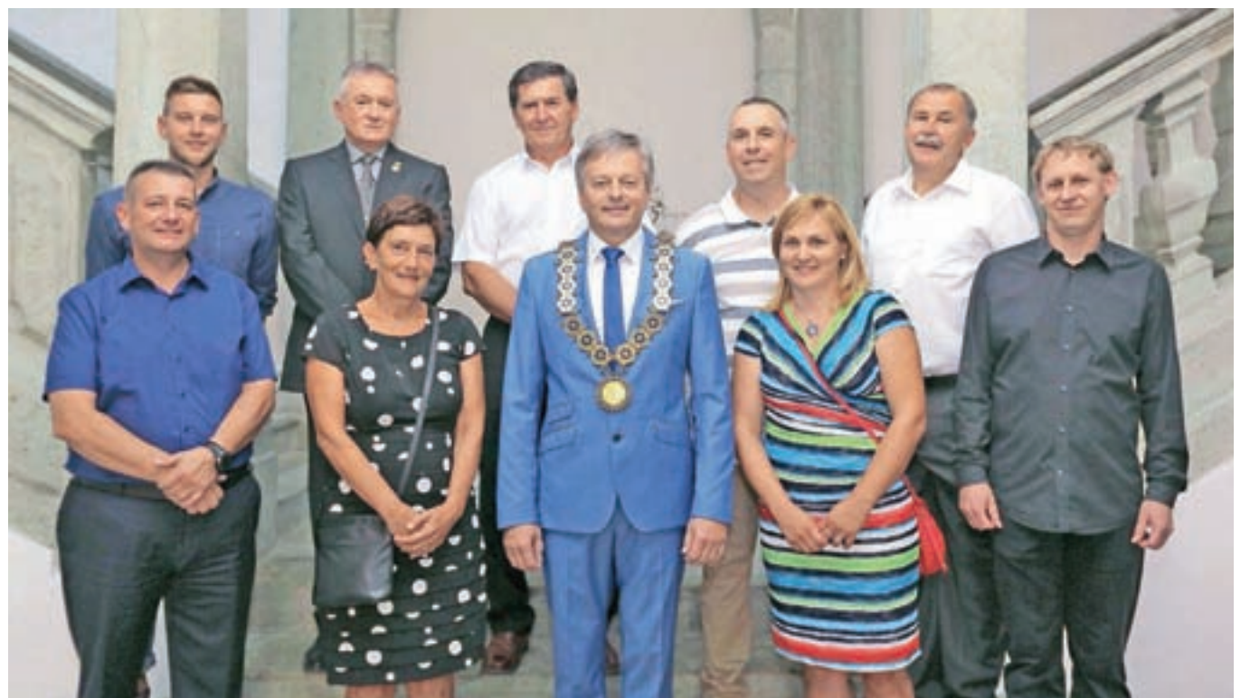
Letošnji nagrajenci z županom / FOTO: GORAZD KAVČIČ

za razvoj prostorske kulture NaNovo, ki deluje v javnem interesu. Njegovo sodelovanje z Občino Radovljica se je začelo s projektom Prisluhni reki Savi – ureditvijo tematske poti, ki na privlačen način predstavlja značilnosti in zanimivosti v prostoru, vezanem na Savo. S projektom Moj grajski park je opozoril na nekdanji sijaj parka ter spodbudil razmišljanja javnosti o prihodnji ureditvi oziroma rabi tega osrednjega mestnega prostora. Za košnjo trave v vzorcu baročnega parka lanske poletje je z zavodom NaNovo pridobil tudi finančno podporo Ministrstva za kulturo. Projekt je bil umeščen v sklop dogodkov Radovljica včeraj za jutri, pri katerih je sodelovalo več organizacij, namenjeni pa so bili predstaviti pomena kulturne dediščine v središču Radovljice in vizij o prihodnosti urejanja našega skupnega javnega prostora. Dr. Maja Kolar je pečat Občine Radovljica dobila za idejno pobudo in sodelovanje pri izvedbi projekta Narava nas uči v Radovljici in v Kranjski Gori vzpostavljena javna učna biodinamična vrtova, ki sta poleg ekološkega uspela pridobiti tudi certifikat Demeter. Doktorica Maja Kolar v projektu sodeluje od vsega začetka ter je s svojim znanjem bistveno pripomogla k vzpostavitvi biodinamičnega vrta.