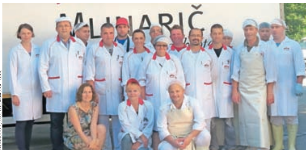
Leški del ekipe Mesarije Mlinarič

Rezultati mednarodnega ocenjevanja mesa in mesnih izdelkov na 55. mednarodnem kmetijsko-živilskem sejmu AGRA 2017.