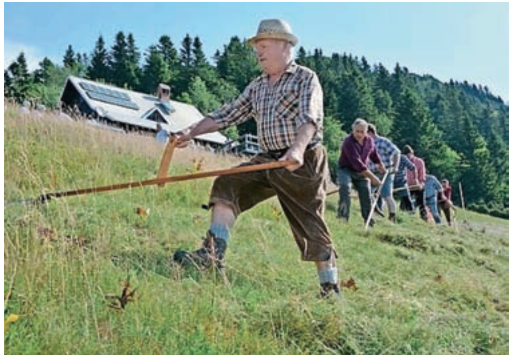
Krepki in odločni zamahi koscev so s kosami zarezali v travo.