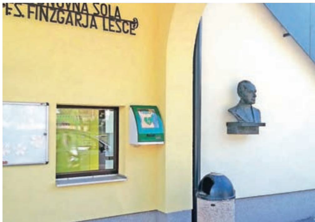
Med šestimi novimi defibrilatorji na območju krajevne skupnosti Lesce je tudi tisti na stavbi Osnovne šole F. S. Finžgarja.