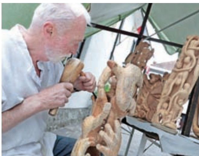
Tržnica s staro rokodelsko tradicijo je na Linhartov trg privabila številne obiskovalce.

Igralska skupina Gašperja Lambergarja je uprizorila Turški napad na viteze, zavrteli se so v baročnih plesih in uprizorili letošnjo novost, postavitev z naslovom Bo ljubezen zanetila meč. V Muzeju Edith Stein v nekdanjem nemškem bunkerju pod cerkvijo sv. Petra pa je Linhartov od v Uri življenja predstavil Edith Stein, izjemno žensko, filozofinjo in svetnico katoliške in protestantske vere, ki je življenje izgubila v zloglasnem Auschwitzu, popoldan pa v graščinski kleti še skeč o prebrisani krošnjarki Meti Romarci.