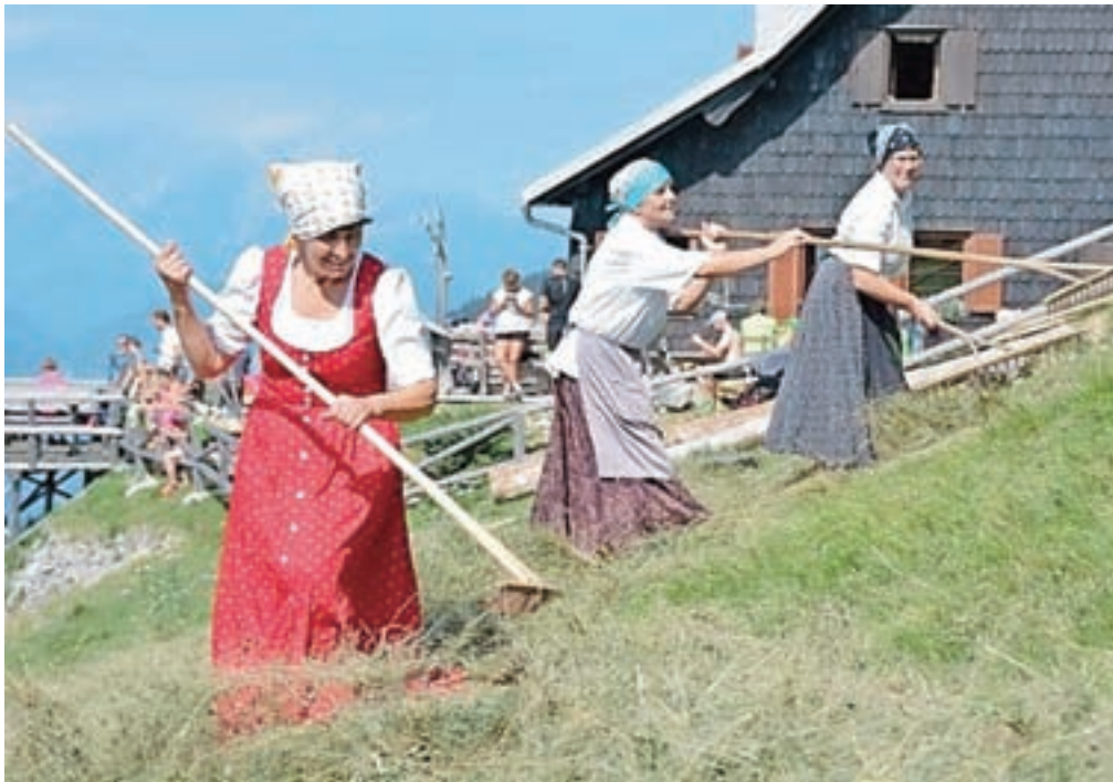
Grabljice so se odžejale z vodo iz izvira Roža.